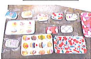
石けんデコパージュ