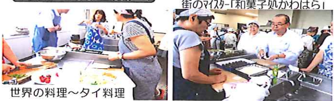
世界の料理~タイ料理